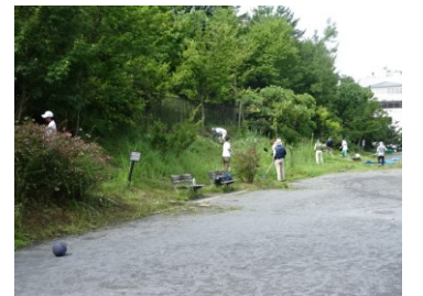
神社側の斜面地は、草の伸びが早いです^^;