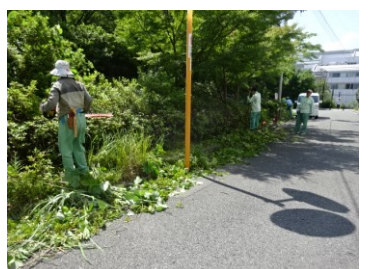
道路公園センターの職員さんには、せり出したもみじの剪定や、ツツジの刈込みをお願いしました