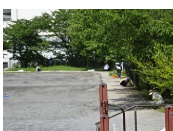
↑広場内の細かな雑草も取り除いてくれました